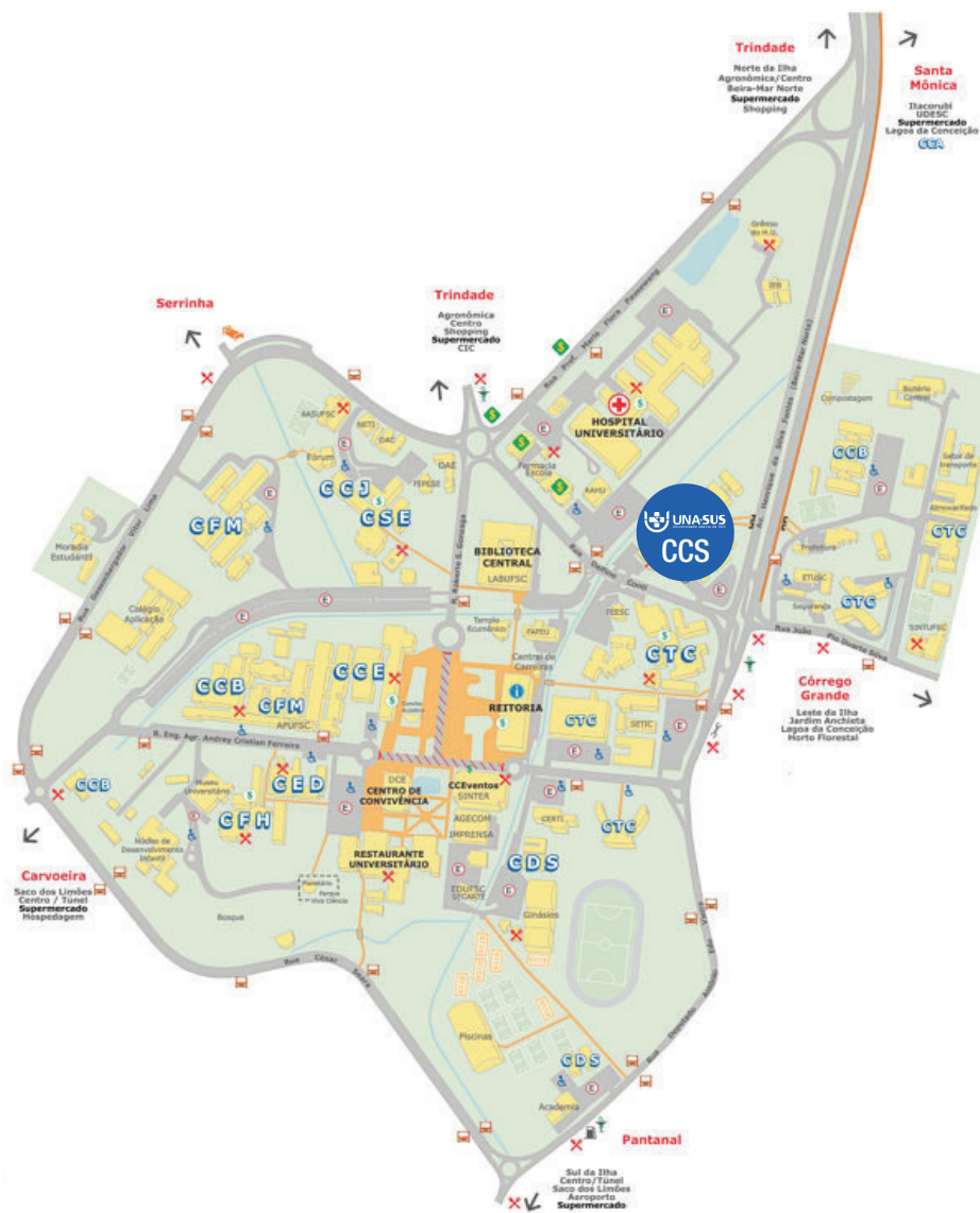
Figura 1 – Mapa do Campus Florianópolis da Universidade Federal de Santa Catarina